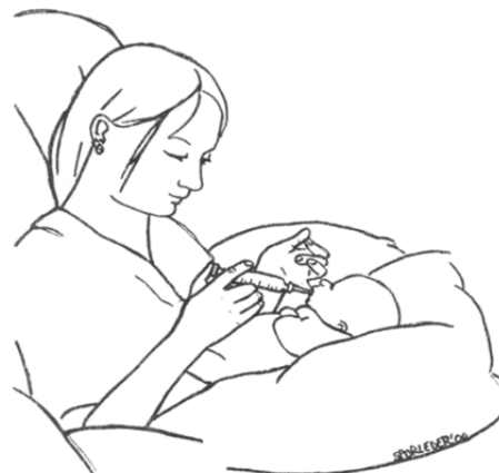
Abbildung 4: Fingerfütterung